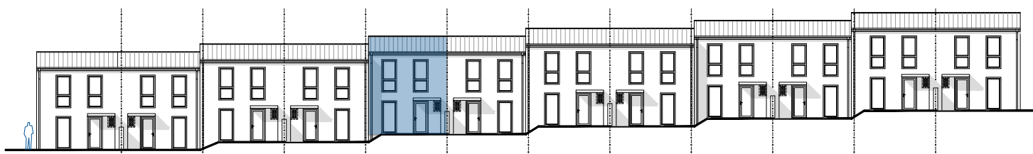
pohled uliční od západu